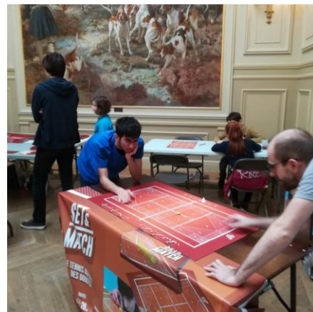
Festival Belligames 2019